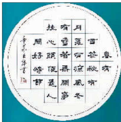
书法 作者 温立军