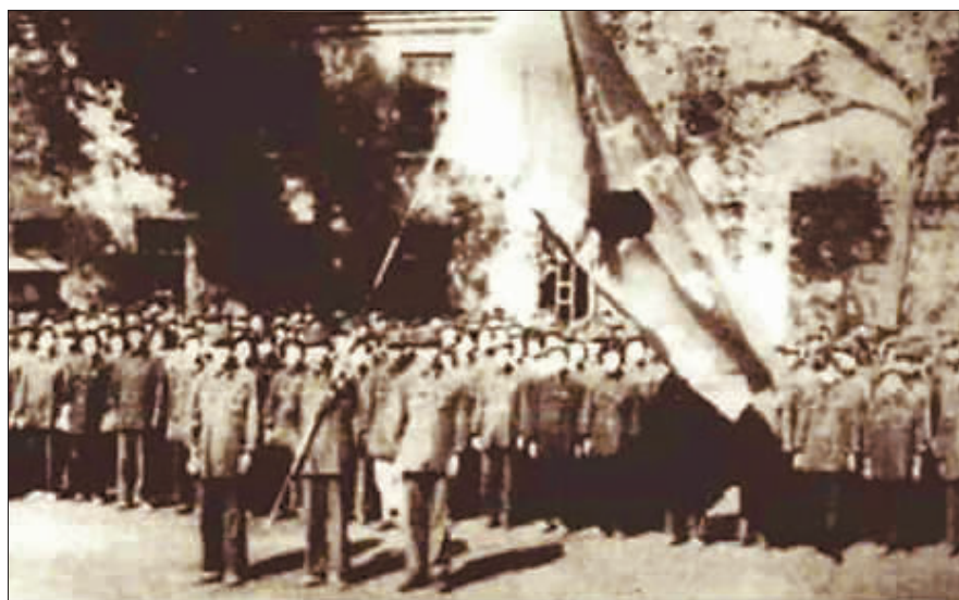
1948年夏,青干校师生参加社会活动前合影。

实精准、故事情节丰富、可读性强等。3.稿件请发送至22304430@qq.com,同时请注明姓名、个人简介(100字以内)、联系方式。