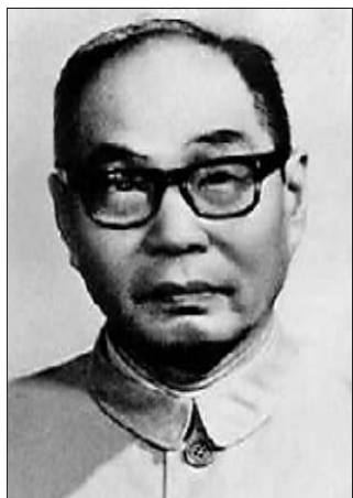
青干校第一任校长蒋南翔。