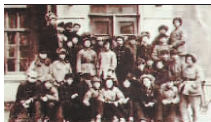
1948年3月,青干校师生从农村参加土地改革归来后合影。

1947年6月2日13时,在位于道里区地段街175号的青干校礼堂举行了开学典礼。时任市委常委、宣传部长的蒋南翔任校长并做了报告,规定校训是为人民服务。