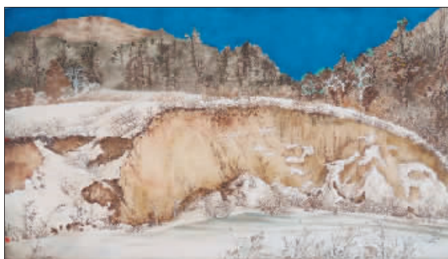
《北方景象》 60cm × 88cm

这幅作品在色彩的运用上独树一帜，主体色彩深邃，点缀色彩灵动，切合主题。艺术风格上，将春风带来的景观氛围相结合，最终赋予画面强烈的视觉冲击与心灵共鸣。