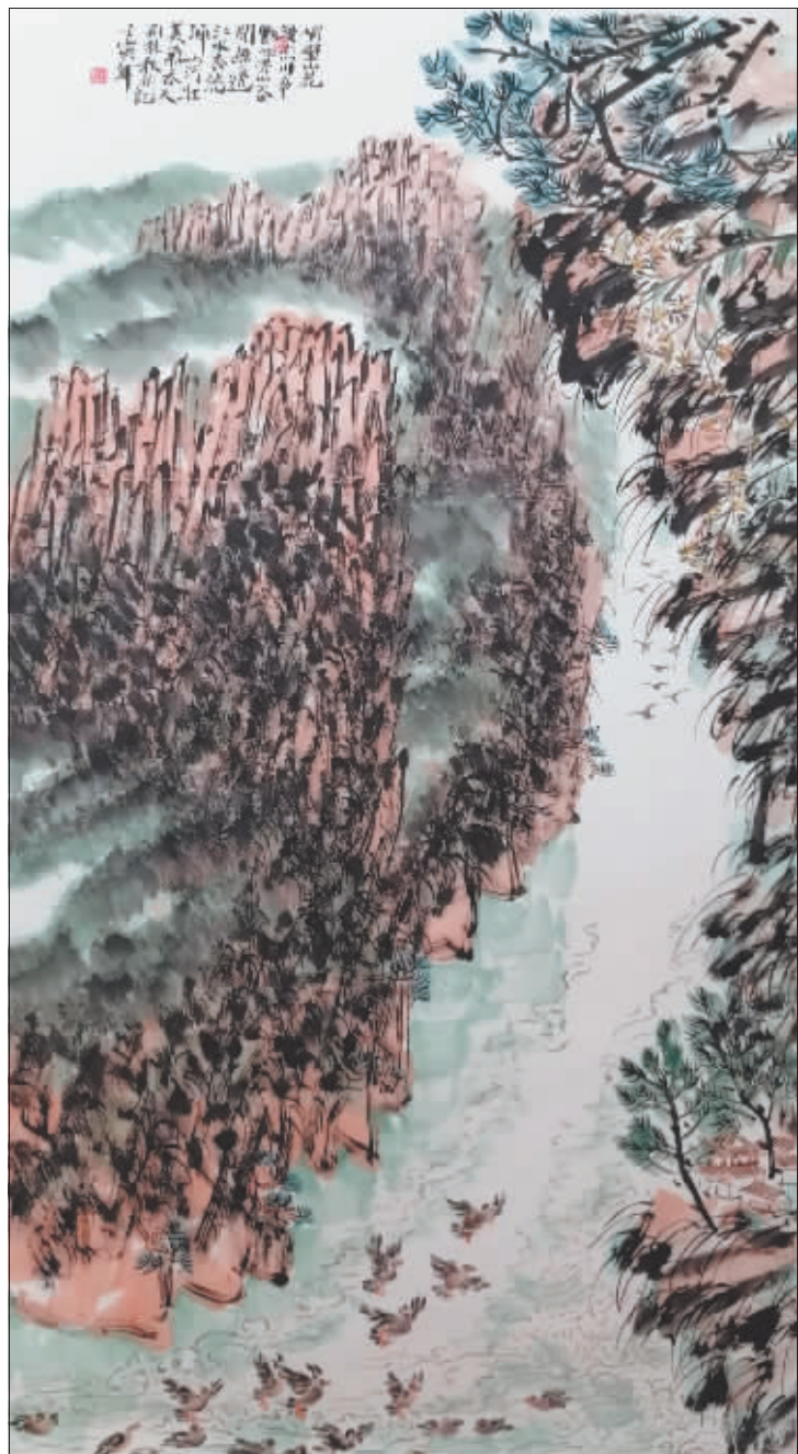
《绥芬河峡谷》 180cm × 96cm

荆桂秋 省美术家协会副主席、省画院创作研究室主任、国家一级美术师、享受国务院政府特殊津贴专家