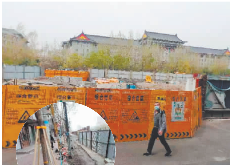
地铁3号线通车半年多,红旗大街(大有坊街至宏图街路段)的围挡仍未拆除。

记者随后与哈尔滨市住建委取得联系。市住建委管处相关负责人邢先生经过了解后表示:“目前管廊公司该项目的主要施工已经结束,只剩下通风口等个别工作尚未结束,另外还有道路尚未恢复,所以围挡没撤。据了解,目前工程中通风口等施工已进入收尾阶段,主要是等温度再回升具备施工条件后,道桥部门将运来材料恢复路面。我们也再督促管廊公司和道桥部门加快工程进度,尽快完成施工,及早拆除该区域的占道围挡。”他还表示,如果条件允许和进展顺利,预计本月中旬道桥部门将展开道路路面恢复施工,6月中旬将拆除围挡,还道于民。