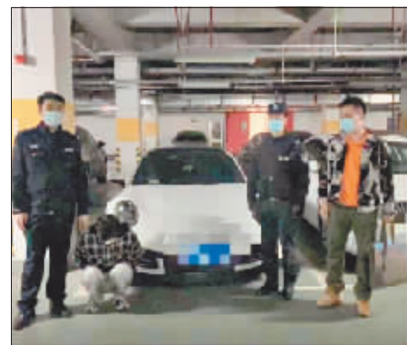
警方查扣非法改装车。

件攻坚。经过近1个月的连续侦查,专案组民警查明了非法改装、竞速车辆的停放地点,固定了涉案人员飙车“炸街”扰民、闯红灯、超速、随意变道、危险驾驶等违法犯罪证据,以及相关涉案人员信息。5月4日,哈尔滨市警方组织交警、巡特警部门开展统一行动,将所有涉案人员、车辆