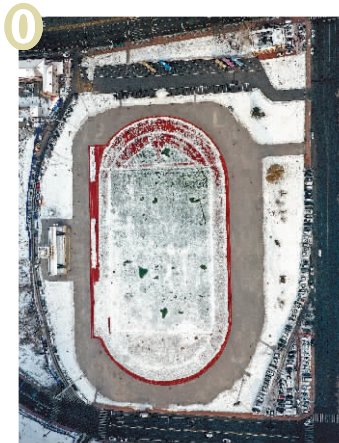
0 改建后八区体育场(道外区)

本报讯冰城哈尔滨是一个有底蕴、有故事的城市,历史根脉深厚,文化气息浓郁,一些历史建筑、特色街区成为“东方小巴黎”的城市文化符号。随着哈尔滨瞄准国际大都市的发展方向,如今的冰城建设不经意间有了“阿拉伯数字”的感觉,成为我们现代化城市的标识之一。在多次航拍中,记者发觉冰城从0—9具有时尚感的建筑物、立交桥等……它们就在我们的身边,是哈尔滨的标志景观。