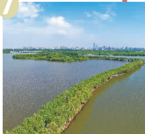
7 哈尔滨一湖三岛(松北区)