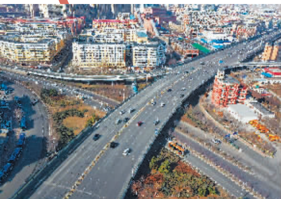
4 连接道里区、南岗区、香坊区的文昌立交桥(南岗区)