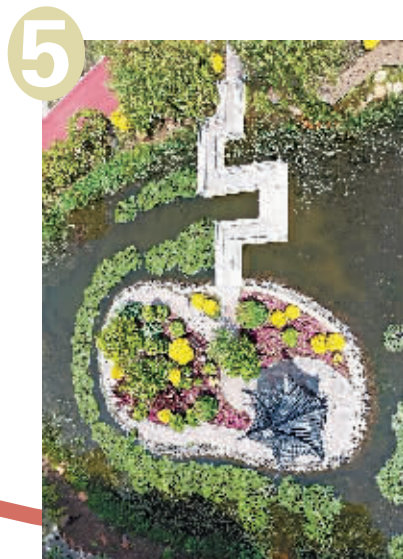
5 哈尔滨亭园(香坊区)