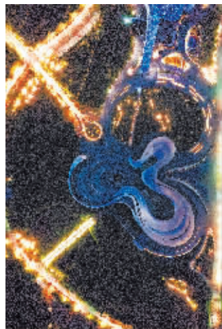
3 哈尔滨大剧院(松北区)