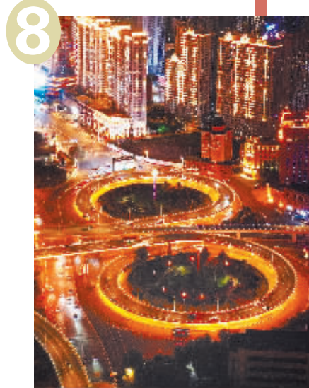
8 哈尔滨公路大桥(道里区)