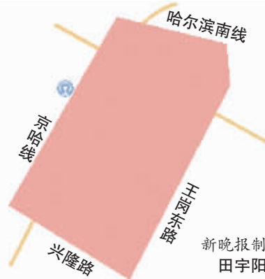
新晚报制图 田宇阳

本报讯(记者 李赫)因哈西加压站供水设备检修,拟定于5月13日7时至17时,东起王岗东路、西至铁路线(京哈线),南起兴隆路、北至铁路线(哈尔滨南线)合围区域及华润置地公馆、红星城、中海云麓公馆、华润置地九里芳华、北大荒集团总医院、金典家园、哈尔滨市第二职业学校分校部分用户停水,周边区域水压降低。停水期间,请广大市民储备好日常用水,关闭好水龙头。