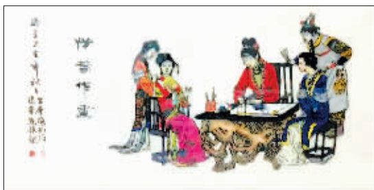
布贴画《惜春作画》作者 苗会梅