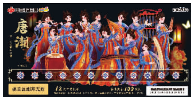
“唐潮—新彩绘散乐浮雕”票面