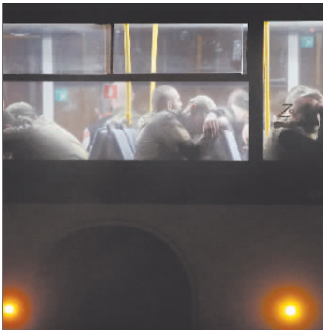
载着乌克兰武装人员的巴士抵达俄军控制的奥列尼夫卡镇。

俄罗斯国防部20日发布声明说,随着最后一批被围困在马里乌波尔亚速钢铁厂内的乌克兰武装人员投降,俄军已完全控制马里乌波尔市。分析人士指出,完全掌握战略重镇马里乌波尔控制权对俄来说具有重要意义,或有助于俄加速推进在乌东部顿巴斯地区的军事行动。