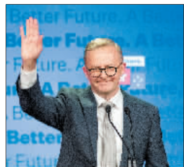
阿尔巴内塞在竞选集会上挥手致意。

安东尼·阿尔巴内塞于1963年3月2日出生于悉尼,毕业于悉尼大学经济学专业。1979年,他加入澳大利亚工党。1996年,他首次当选澳联邦议会众议院议员。在工党政府执政期间,他曾担任基础设施建设和交通部长等职务,并于2013年短暂担任工党副党首和澳副总理。2019年5月,他开始担任工党党首。