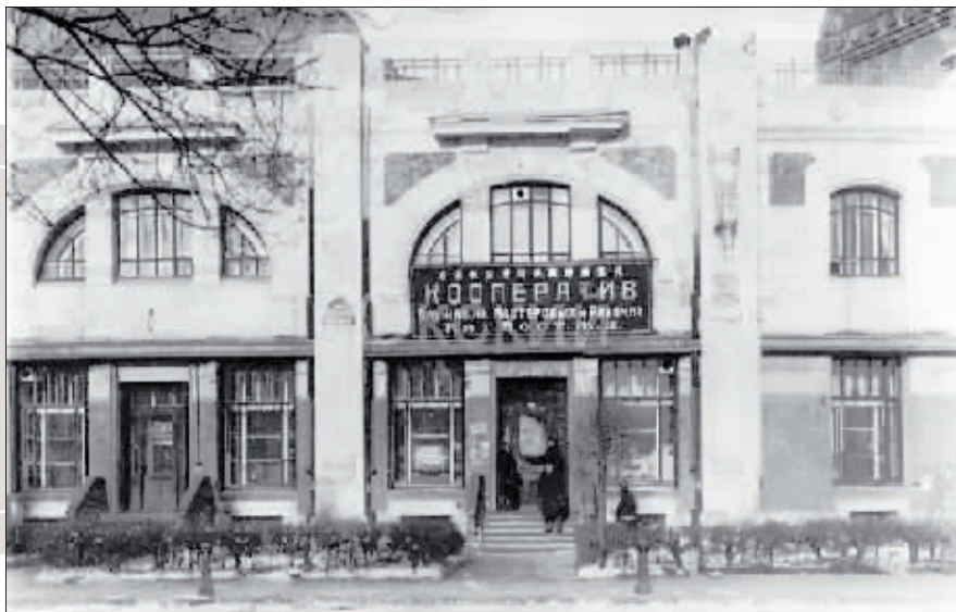
▲20世纪30年代北满铁路职工消费公社商店正门。

事过境迁,在铁路不同历史时期,合作社作为福利机构,让铁路职工家属受益,节省职工生活支出,改善了职工生活;在解放战争时期,还有力地支援了解放战争。尽管“合作社”早已退出了历史舞台,但留给人们的仍然是美好、不可磨灭的记忆。