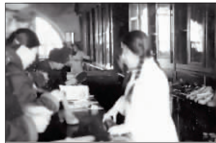
▲20世纪50年代设在南岗铁路售票所楼上(现秋林商厦址)的铁路商店。