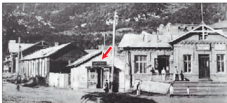
图中箭头所指建筑为20世纪初横道河子铁路职工合作社生肉铺。