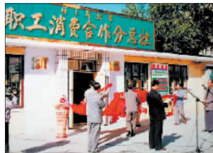
▲20世纪90年代佳木斯铁路职工消费合作分总社揭牌。