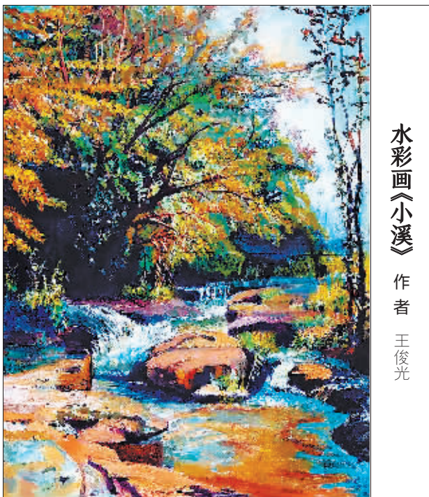
水彩画《小溪》作者 王俊光