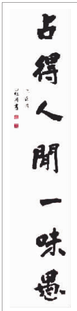
书法 作者 庄冉 占得人间一味愚