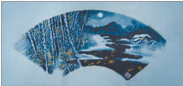
国画《故乡明月》作者 李传民