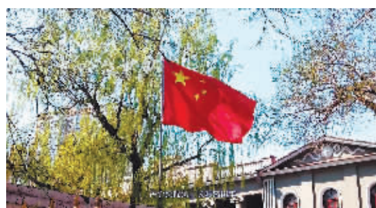
最佳纪录片奖《巨木不蠹》 哈尔滨商业大学