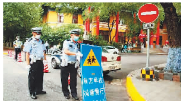
设立警示牌。

高考期间,考生乘坐车辆凭证不受限行路段规定的限制。考生在出行过程中,如遇到交通拥堵,忘带身份证、准考证和走错考场等紧急情况时,可第一时间向路面交警求助。交管部门将设立铁骑护考小分队,并在警车上粘贴“保驾护航为高考”的暖心护考贴,遇考生紧急求助,开辟“绿色通道”,及时予以帮助。