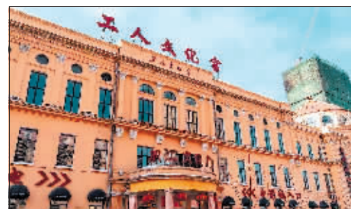
现在的工人文化宫

哈尔滨市工人文化宫的欧式建筑风格与哈尔滨老城的欧陆风情十分契合，是著名的城市地标性建筑，是哈尔滨著名的网红打卡地。文化宫坚持公益定位，打造公益活动品牌，创新文化服务模式，将文化宫建设成为职工的一方乐土和精神家园。2017年，工人文化宫获得黑龙江省五一劳动奖状，2019年获得省级文明单位标兵称号。2019年，全国总工会领导视察工人文化宫的工运历史展览馆，对工人文化宫的工作给予了高度评价。