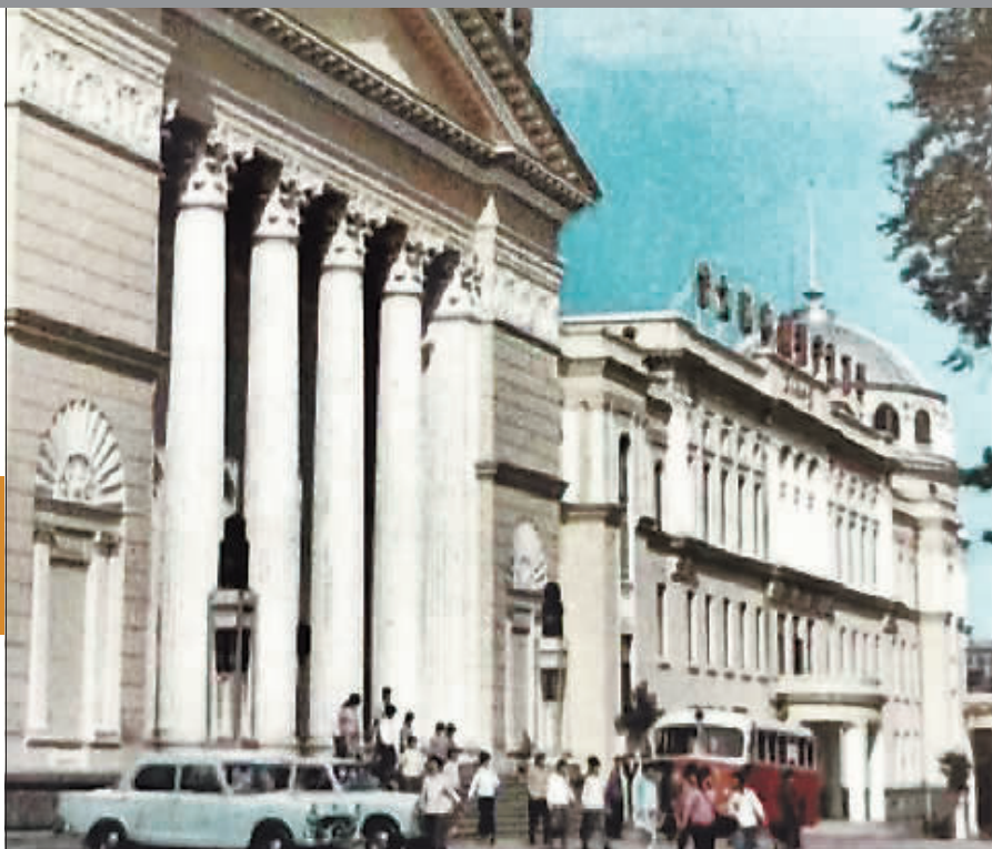
昔日的工人文化宫