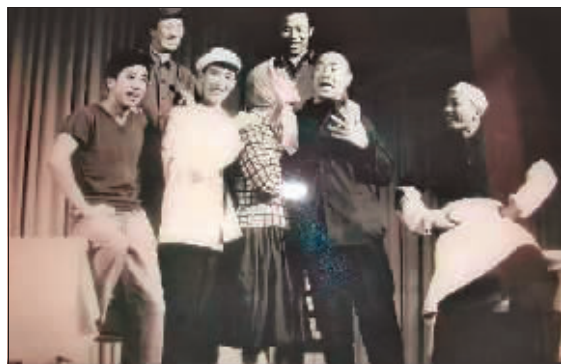
工人文化宫曲艺队演出