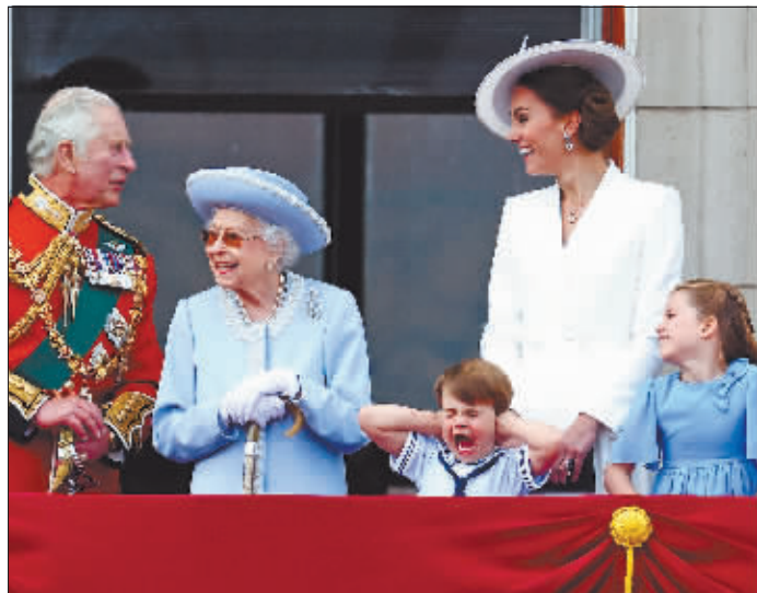
在英国伦敦，英女王伊丽莎白二世(左二)等王室成员在白金汉宫阳台上观看庆祝活动。

官方庆典活动以阅兵式开始。1500名士兵身着传统服饰，从白金汉宫前林荫大道列队走过。伊丽莎白二世身着浅蓝色套装、戴同色礼帽，拄拐杖缓缓走到白金汉宫阳台，面带笑容，向数万人挥手致意。