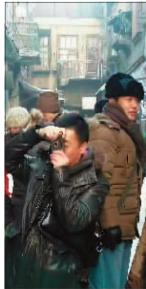
松光胡同是来哈尔滨拍摄影视的摄制组使用最多的外景地。