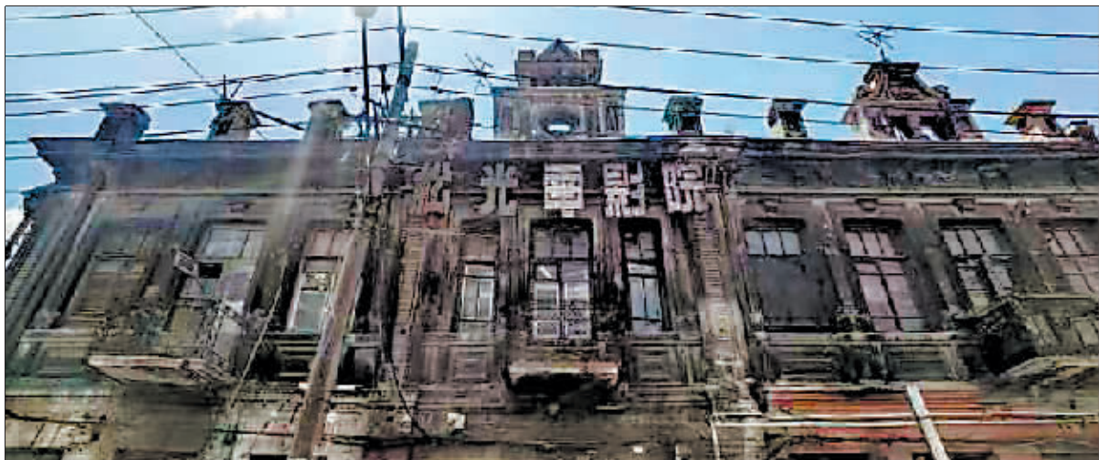
历经岁月冲刷的松光电影院。