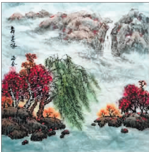
国画《舞春风》作者 陆海春

秀出书画佳作,分享诗歌、散文等,欢迎提供原创图文。文章字数在300-800字之间;书画图片大小在1M以上,并注明姓名及联系方式。作品请发至1372136484@qq.com。