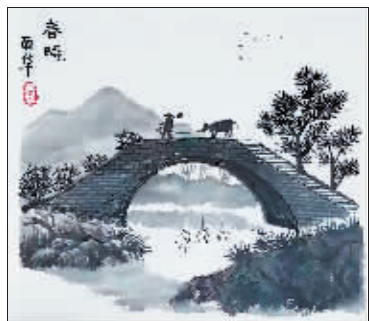
国画《春晓》作者 丽华