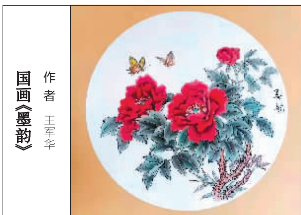
国画《墨韵》 作者 王军华