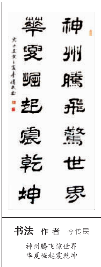
书法 作者 李传民 神州腾飞惊世界 华夏崛起震乾坤