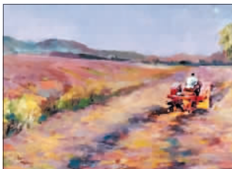
油画《耕耘》 作者 聂振达