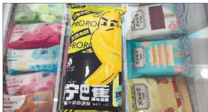
各种造型奇特、口味新颖的冰激凌。

“我家店里的冰激凌多达592个品种。”店主告诉记者，“这样的冰激凌专卖店，我打算今年内在哈市再开5家。”记者在采访中了解到，去年下半年开始，冰激凌专卖店亮相哈市街头，至今已经陆续开了几十家了，有的店经营的冰激凌品种多达1000多种。