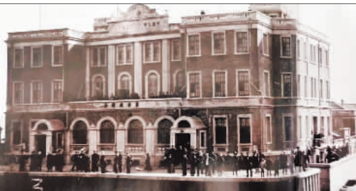
当年的东北航务局办公楼（现道外区江畔路）。

精准、故事情节丰富、可读性强等。3. 稿件请发送至22304430@qq.com，同时请注明姓名、个人简介（100字以内）、联系方式。