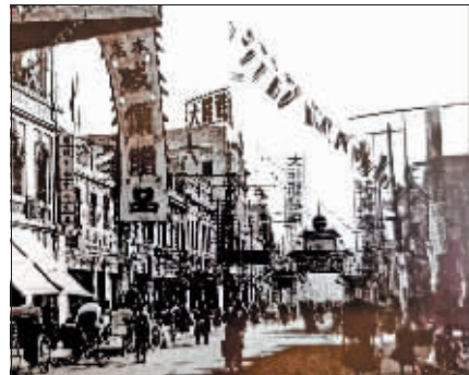
当年坐落在正阳头道街上的大罗新环球货店。