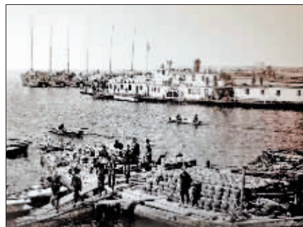
20世纪三四十年代傅家甸运货码头。

老道外是哈尔滨历史上民族工业的聚集地，其中制粉业、油坊业、铁业、织染业、酿酒业、木材加工业产值占比较大。规模以上面粉厂有广泰祥、东兴、第一面粉厂、裕昌源、忠兴福、广信通等28家，总资本400万元。油坊12家，总资本300万元。每年生产豆饼1000万片，豆油1.4万吨，年面粉销售收入约3500万元。拥有祥泰、民生、聚兴、祥发等一批铁工厂。据1930年对该地区331家工厂和生产情况的调查，该地区拥有了印刷业、玻璃工业、皮革业、服