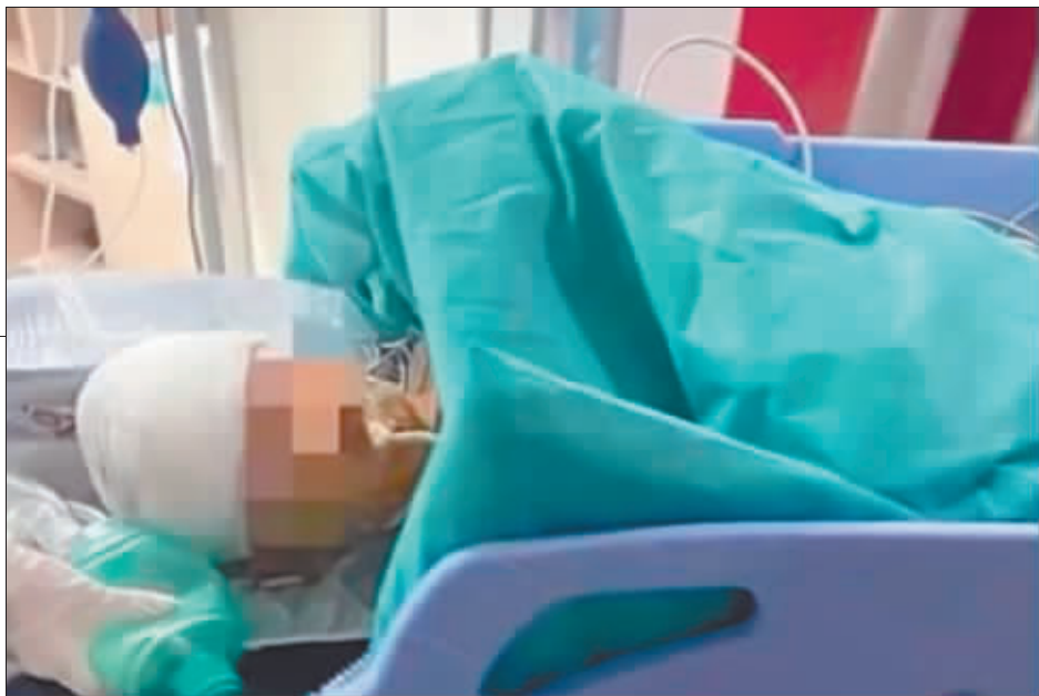
在事发26天后，受伤男童在医院经抢救无效不幸死亡。

这份资料还称，家长于5月26日报警，警方立刻就控制了王某和四名老师。单独询问后，四名老师口供一致，描述了王某的“殴打”过程。受害者在中山三院经26天的抢救后于6月20日凌晨5时23分离世，并于6月21日早晨在广州市公安局法医解剖检验中心进行了尸检。