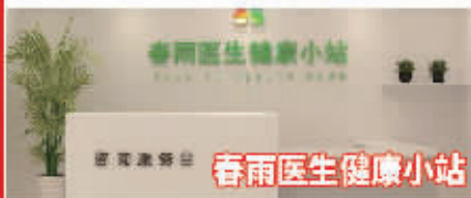
春雨医生健康小站