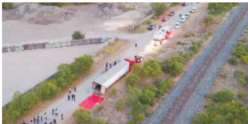
27日，应急人员在圣安东尼奥移民死亡事件现场工作。

法部门多名不愿公开姓名的官员告诉记者，这辆卡车原本可能载有约100人，看似要将移民运至他们将工作的地方。移民们身上被喷洒了有刺鼻气味的物质，这是人口走私集团用来躲避警犬嗅探的方式之一。