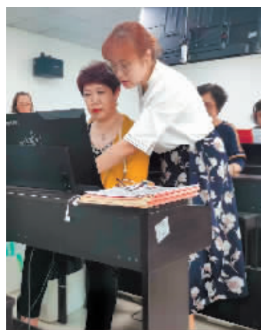
姜老师(右)在指导学生。