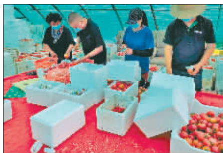
工作人员包装“熊猫柿子”。