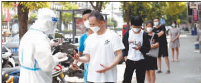
3日,泗县虹城街道一小区,居民排队等候接受核酸采样。

此外,安徽省各地联防联控紧急排查6月10日以来有泗县旅居史人员9136人,其中合肥、濉溪、固镇、灵璧等地零星关联感染及其密接、次密接者得到有效管控,其他相关人员及区域多轮核酸检测均为阴性。