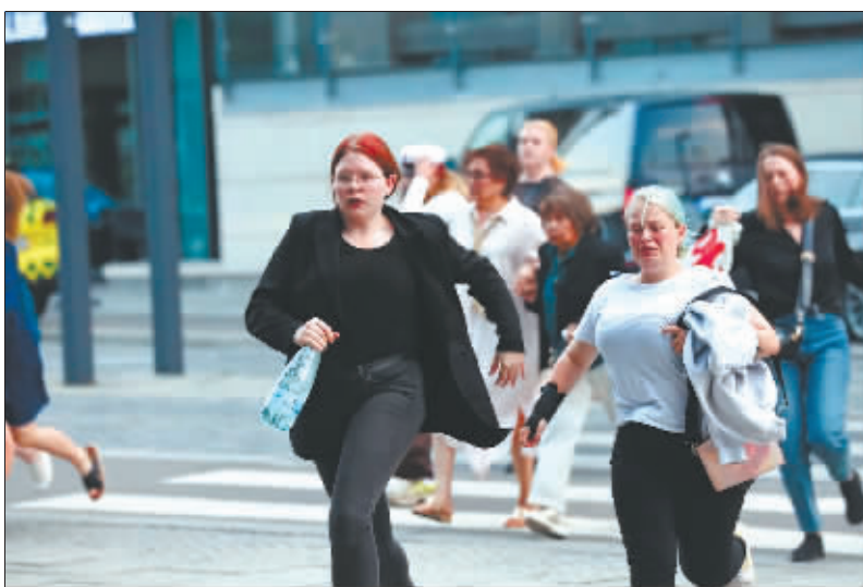
枪击发生时,人们惊慌逃离现场。

森说,警方在现场附近逮捕一名22岁丹麦男子。枪击事件造成两男一女死亡,另有多人受伤,其中3人伤势严重。