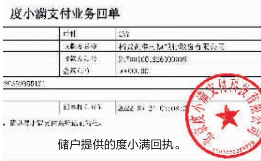
储户提供的度小满回执。