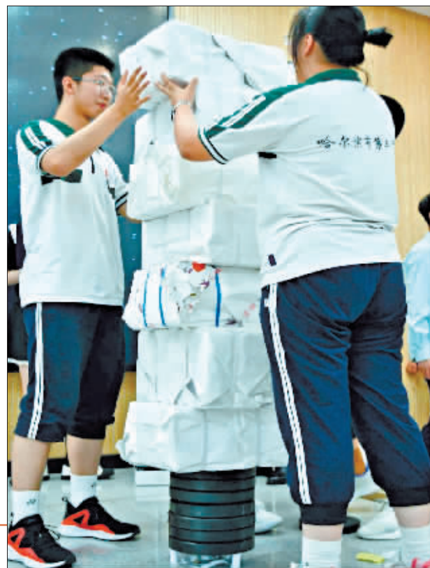
一人多高的“书山”压在纸模型上,也没有塌。

此次比赛不仅使同学们的精巧构思得以实现,也培养了他们的创造能力和动手能力。轻薄的A4纸筑起的不仅是承重的基座,更是智慧的桥梁。