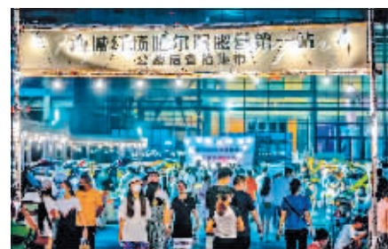
西城红场搭建后备厢集市。