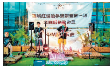
引入西城说乐队,丰富集市内容。

西城红场冰城青创汇崔经理说,集市每天都会开,周五、周六、周日晚上参与的人最多。“后备厢集市”不仅为文艺范的西城红场带来了烟火气,还将现代年轻人的生活态度融入方寸后备厢,成为一种创新的经营业态,促进新就业、释放消费潜力。