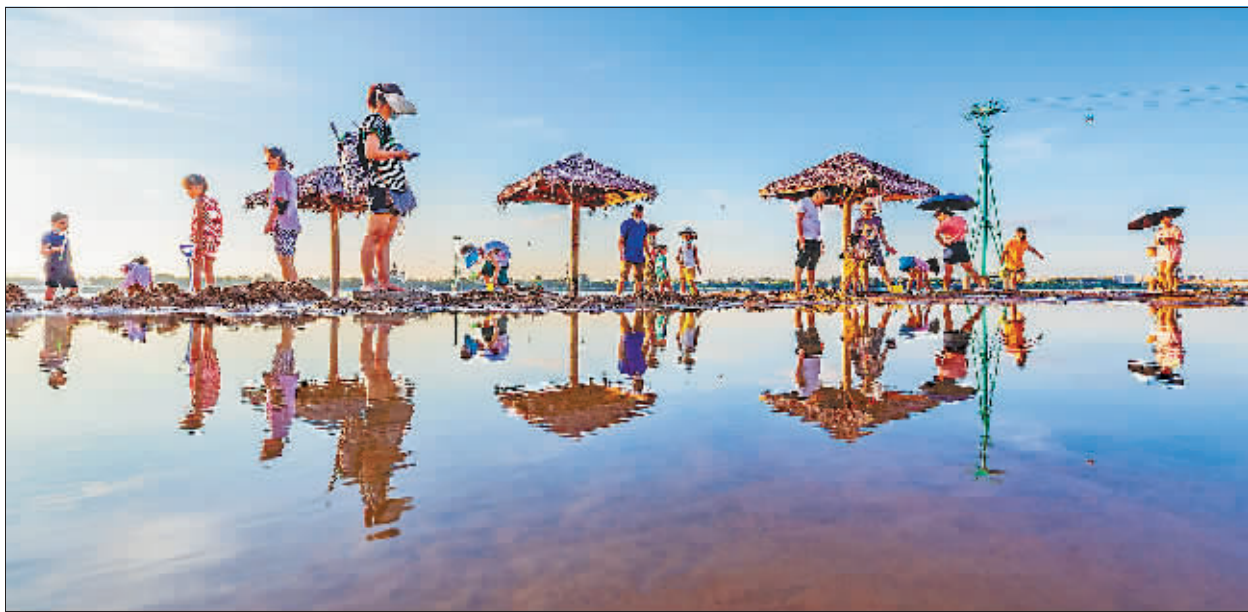
盛夏时节,市民来到松花江畔度过清凉夏日。