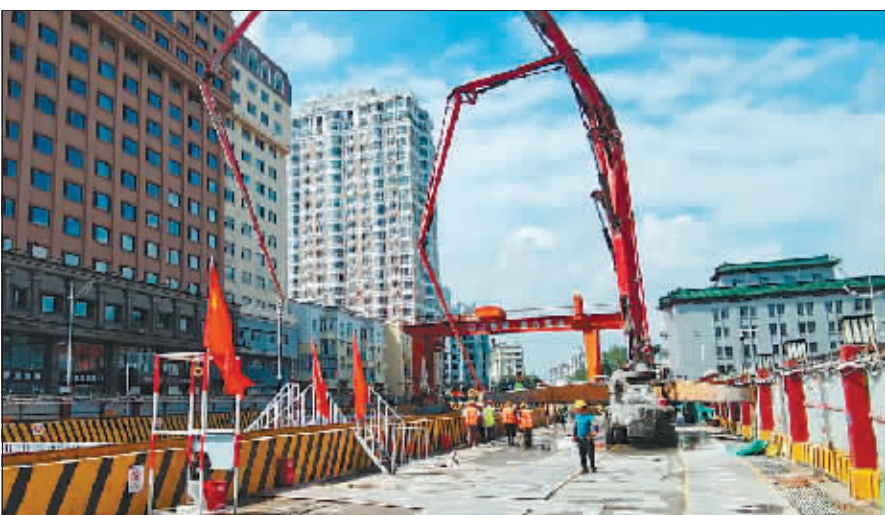
地铁3号线友谊宫站提前顺利封顶。

下一步,地铁施工将全力以赴向兆麟公园站主体结构封顶与友谊宫站附属结构施工的目标进发。