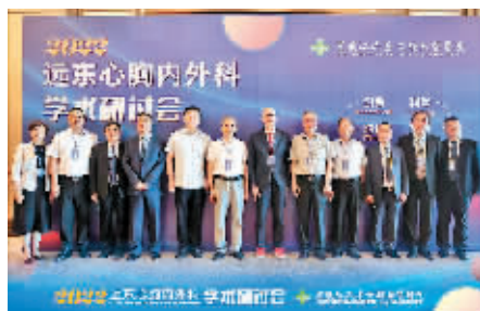
远东心胸内外科学术研讨会嘉宾合影

据了解,学术会在一定程度上提升了不同区域医疗机构心胸内外科的整体诊疗水平,使得基层医院的诊疗水平有所提高,这将加大首诊的准确性,对于结节早期发现并及时干预提供了有利条件。