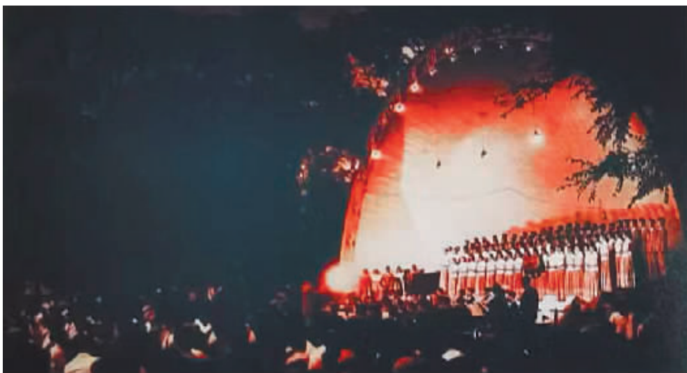
首届“哈夏”音乐会在哈铁文化宫贝壳舞台上的演出现场。

首届“哈夏”之后，辽、吉两省提出了三省合办，轮流坐庄的意向。于是，三省联办的第二届“哈夏”音乐会于1962年7月13日晚在哈尔滨