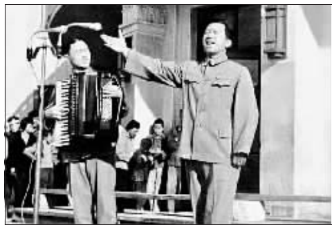
首届“哈夏”音乐会上，著名艺术家郭颂、刘克纪在演出。

哈尔滨，一座被中西文化艺术浸染的城市，20世纪60年代初，在最为困难的时候，哈尔滨市委集全市民的智慧，创办了哈尔滨之夏音乐会，《乌苏里江船歌》《新货郎》《太阳岛上》《我爱你塞北的雪》成为哈尔滨之夏音乐会的代表作，这些作品也成为哈尔滨的城市名片、哈尔滨音乐之城的标志。