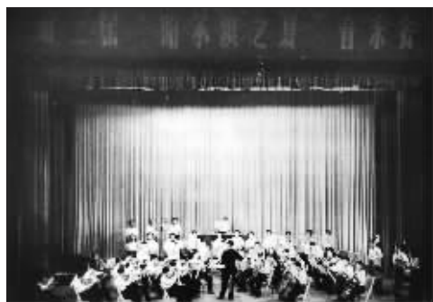
第二届“哈夏”音乐会演出现场。

在“哈夏”中断了12年以后的1979年，第七届哈尔滨之夏音乐会再次展现在世人面前。1979年7月13日第七届哈尔滨之夏音乐会在黑