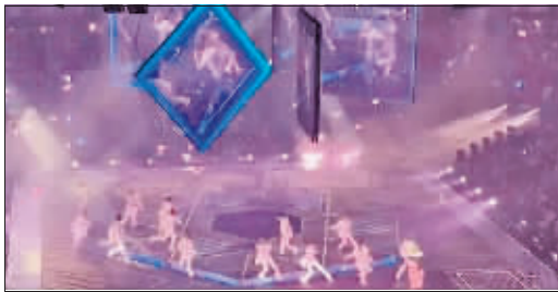
吊在舞台中央的电子屏幕。