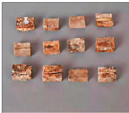
徐州黑头山西汉刘慎墓出土的六博棋子。

博具除了用于六博游戏,有些还有其他的用途。博局可以用于占卜,江苏东海尹湾汉简就有一篇《博局占》,系利用博局来进行占卜;博戟也有的用于行酒令,这种酒令戟的形制,与普通博戟大致相同,