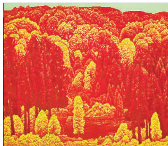
《火红的日子》 75cm × 90cm