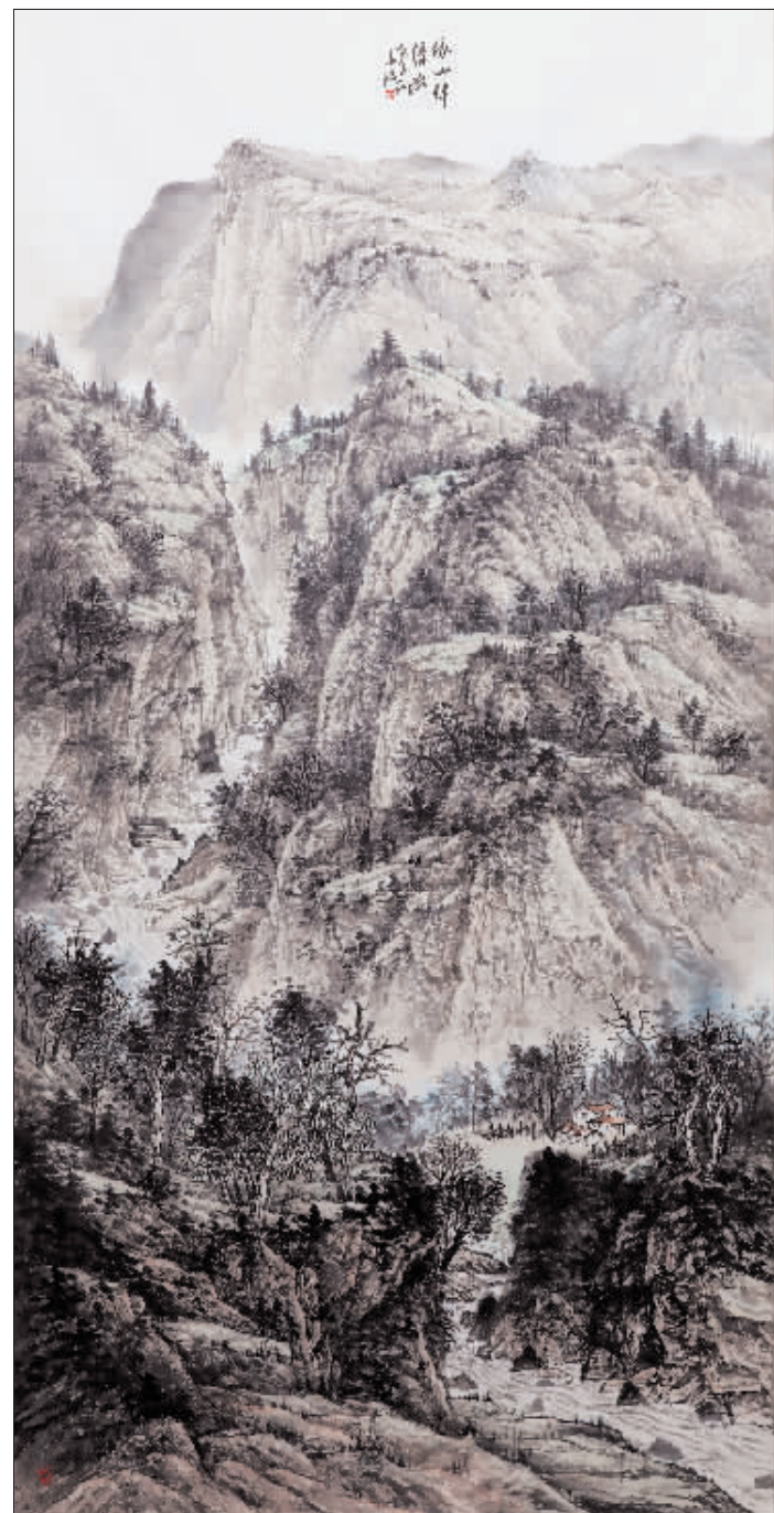
《依山伴清流》 235cm × 129cm