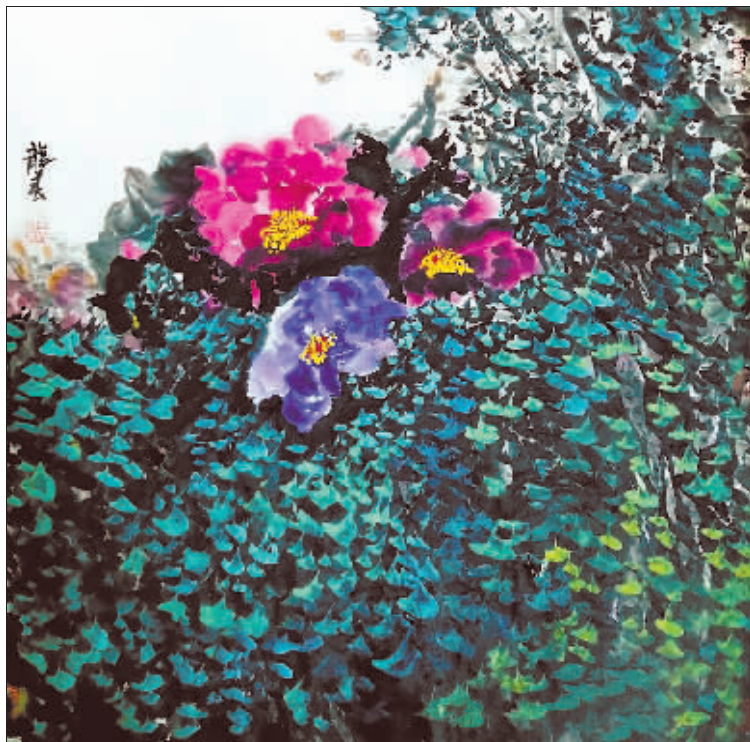
《富贵花丛中》 68 × 68cm

这幅气势恢宏的画作运用了传统与现代相结合的表现手法，以墨色为主，辅以浅绛淡色，并略施花青。画家用墨色及透视关系，把山分成远、中、近三个层次，使画面既有势有静，又有动有生活。