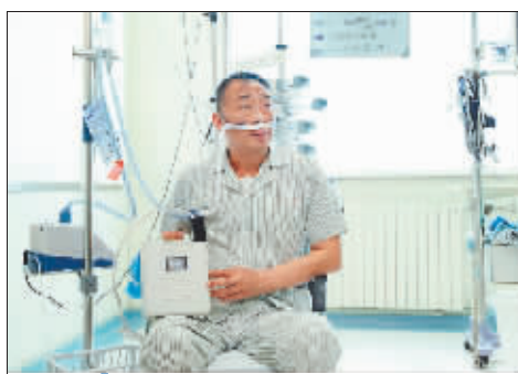
患者与“人工心脏”体外电池包和控制器。

谢宝栋教授指出,黑龙江首例“人工心脏”植入的开展为广大心衰患者带来全新希望,从此黑龙江有了自己的“人工心脏”团队,标志着哈医大一院具备了终末期心脏病的所有高水平治疗方式,心脏大血管外科诊疗能力达到国内先进水平。