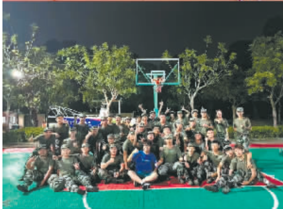
00后大学毕业生初入职参加军训后合影。