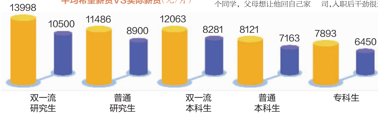
应届毕业生平均希望薪资VS实际薪资(元/月)