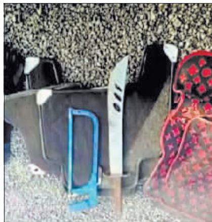
斗殴时使用的砍刀等凶器。