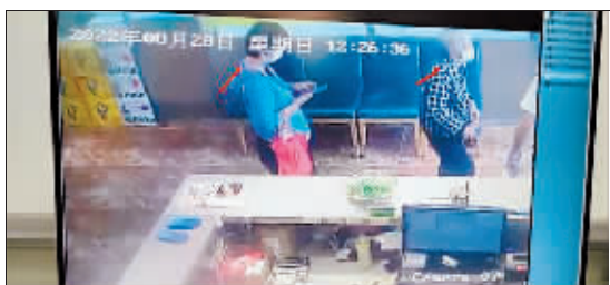
图片中红色箭头指向的一名老年女性和一名中年女性。