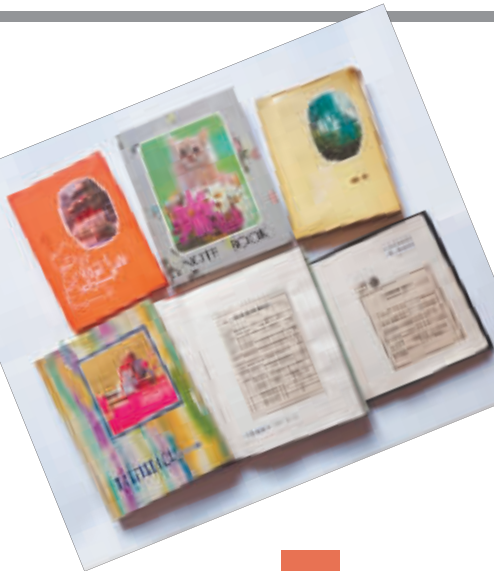
苑金山粘帖剪报的小本子。