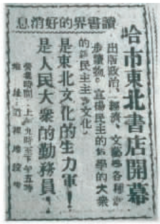
哈尔滨东北书店门市部开业时广告。