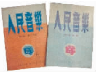
在哈尔滨复刊的《人民音乐》。