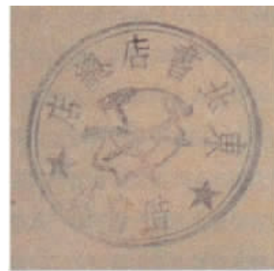
东北书店总店借书处图章。