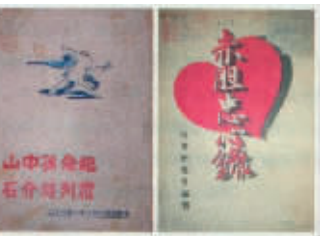
东北书店销售“外版书”书影。