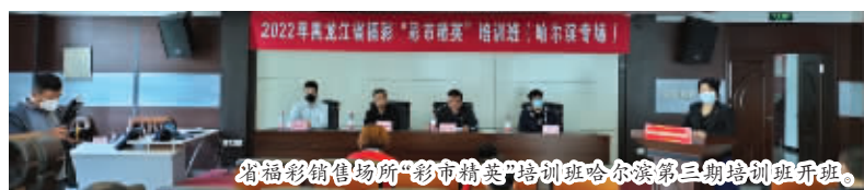
省福彩销售场所“彩市精英”培训班哈尔滨第三期培训班开班。

27日上午9时，黑龙江福彩销售场所“彩市精英”培训班哈尔滨第三期培训班，在市福彩中心开班，来自道里区和南岗区的10名代销者参加了此次培训活动。市福利彩票发行中心片区专管员全程参加培训，为参训站点销售员提供服务。