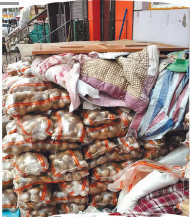
新晚报制图/宋占晨