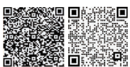
扫码领取电子社保卡 扫码添加企业微信

下一步,工商银行哈尔滨分行将持续发挥金融助力“民生”作用,持续延伸服务触角,逐步增加受理服务事项,努力打造“15分钟社保服务圈”,让群众享受更优质、便捷、暖心的社保服务。