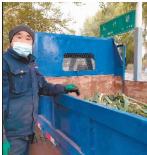
□本报记者 张鸣霄 文/摄