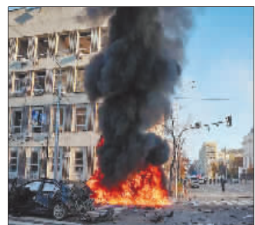
10日，基辅市中心发生多起爆炸。

中国驻乌克兰大使馆微信公众号10日发消息称，当前乌全境空袭频繁，安全形势严峻。中国驻乌克兰大使馆再次提醒所有中国公民，自国内不要来乌，自第三国不要返乌，坚持留乌人员务必做好应急和避险。请大家珍惜生命，远离风险。