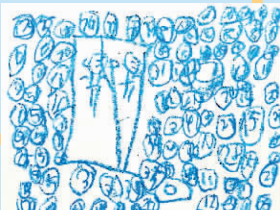
本栏涂鸦作品由随心涂鸦亲子俱乐部学生创作。

春风吹化了冬雪,时间消逝了岁月,回首十三年的光阴,一声声鼓励让我从低谷中爬起,陪伴我慢慢长大。