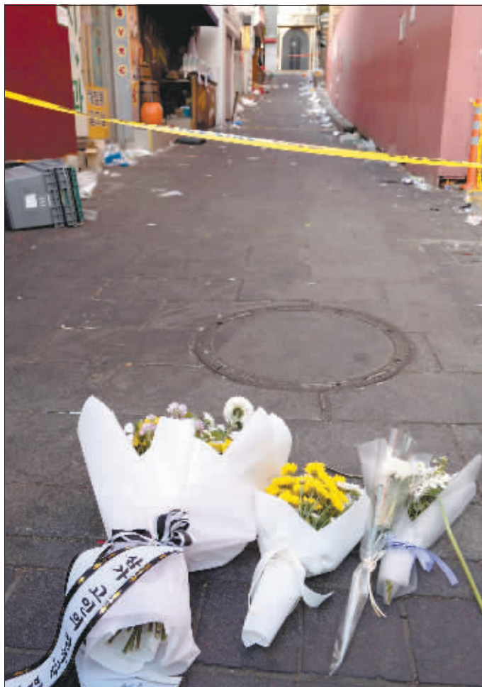
在韩国首尔踩踏事件现场拍摄的悼念鲜花。

尹锡悦1日在内阁会议上说，这次踩踏事件显示韩国缺乏对人群管理的研究，迫切需要加强这一方面的制度。他提出采用无人机等技术手段提高人群管理能力。不过，批评者指出，这方面的技术手段已经存在，但在梨泰院踩踏事件中并没有使用。