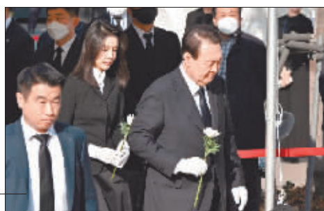
韩国总统尹锡悦吊唁踩踏事件遇难者。