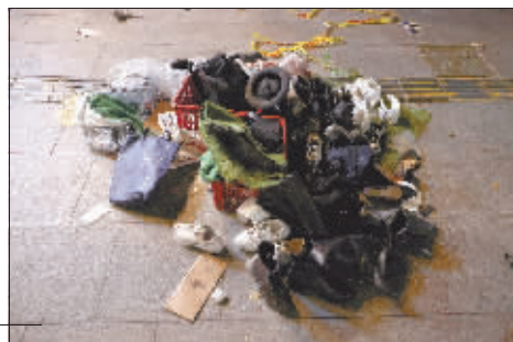
在踩踏事件现场散落的物品。