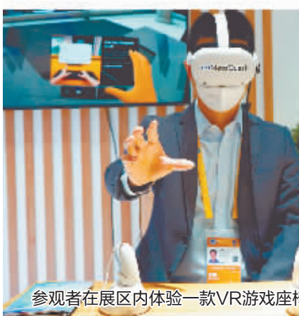
参观者在展区内体验一款VR游戏座椅。