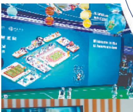
↑人工智能专区观看机器人表演。