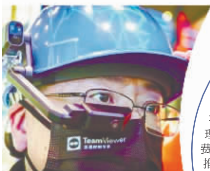
↑智能眼镜连接现实和虚拟世界。